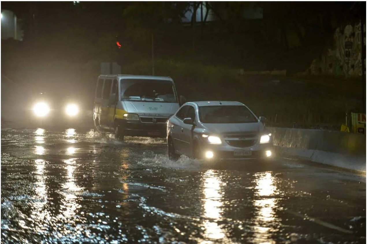
Chuva forte atinge a capital mineira - Fred Magno - 18.dez.22/O Tempo

Os dados são do Inmet (Instituto Nacional de Meteorologia). Segundo Noele Brito, meteorologista do Climatempo, os registros mais extremos para esse período se devem ao La Niña ( https://www1.folha.uol.com.br/cotidiano/2021/12/chuvas-na-bahia-sao-reflexo-de-la-nina-e-aumento-da-temperatura-no-oceano.shtml ), que resfriou as águas costeiras e favoreceu a formação de áreas de baixa pressão, contribuindo para dias seguidos de céu nublado e volumes expressivos de chuva.