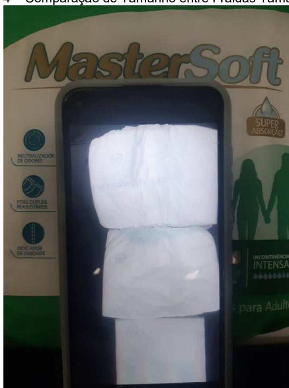
Figura 4 – Comparação de Tamanho entre Fraldas Tamanho “P”