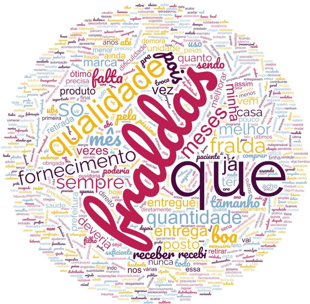
Figura 6 – Nuvem de Palavras a partir de Respostas à Questão sobre o Programa de Fornecimento de Fraldas

Fonte: Própria, a partir das respostas apresentadas à última questão do questionário disponibilizado aos usuários (peça 40).